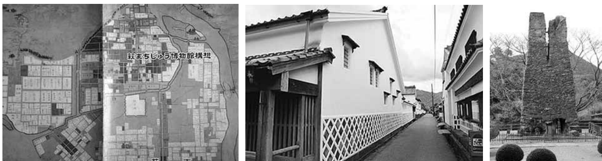
Рис. 2. Історична тканина міста Хагі: мапа періоду Едо, що актуально досі; збережена квартальна забудова самурайських садиб; залишки старовинної плавильної печі (пам'ятка ЮНЕСКО)

Під час промислової революції епохи Мейджі (1868–1912) в Хагі потужно розвивалася промисловість: суднобудування, металургія та інші галузі. У 2015 р. кілька промислових об'єктів Хагі епохи Мейджі були зареєстровані в ЮНЕСКО як частина загальнодержавних “пам'яток промислової революції Мейджі в Японії: чорна металургія, суднобудування та видобуток вугілля” (明治日本の産業革命世界遺産, див. рис. 2). Для управління новою культурною спадщиною в Хагі було створено музей Хагі Мейрін Гакушя та туристично-інформаційний центр, розташовані у будівлі колишньої початкової школи періоду Мейджі. У цій будівлі також розміщується “Рада з промоції геопарку Хагі”, що здійснює діяльність національного проекту геопарк, до мережі якого Хагі приєдналося у 2018 р. Діяльність проекту геопарк пов'язана з науковим, науково-популярним та картографічним дослідженням унікальних вулканічних територій міста Хагі та навколишнього регіону.