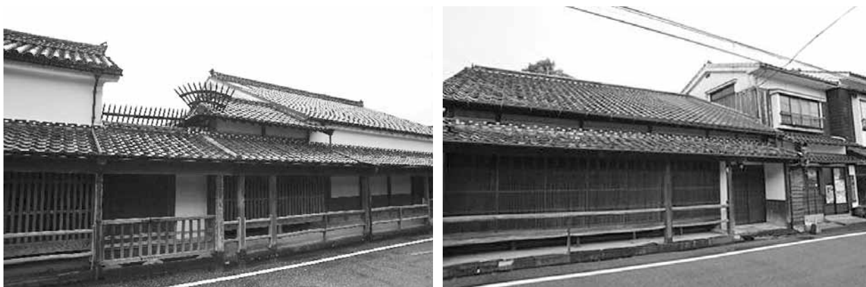
Рис. 3. Музеїфіковані резиденції родин Кікуя та Кубота в Хагі

Рух за збереження історичної пам'яті в місті зародився у 1970-х роках, коли працівники мерії та місцеві активісти утворили “Хагі о-айсуру кай” (“Асоціацію любителів Хагі”). Наприкінці 90-х років, за участю науковців та громад під керівництвом мера Кодзі Номура народилася ідея “Музею Хагі Мачідзю Хакубуцукан” (“Музей Хагі – як цілого міста”), яка полягає не лише у збереженні кожної будівлі в місті Хагі, але і в збереженні всього міста та його довкілля як музею під відкритим небом. На сьогодні мерія та її філіал – музей Хагі Мачідзю Хакубуцукан керують усіма заходами, що проводяться щодо збереження історичного образу міста, надаючи субсидії на ремонт приватної житлової забудови старих кварталів, ініціюючи різноманітні заходи місцевих громад, а також координуючи менеджмент, музеєфікацію та громадське використання історичних будинків, що перейшли у власність міста (у співпраці з Асоціацією туристичних гідів Хагі). Зокрема, показовими є приклади музеєфікації та організації туристичного відвідування садиб родин Кікуя та Кубота (рис. 3)