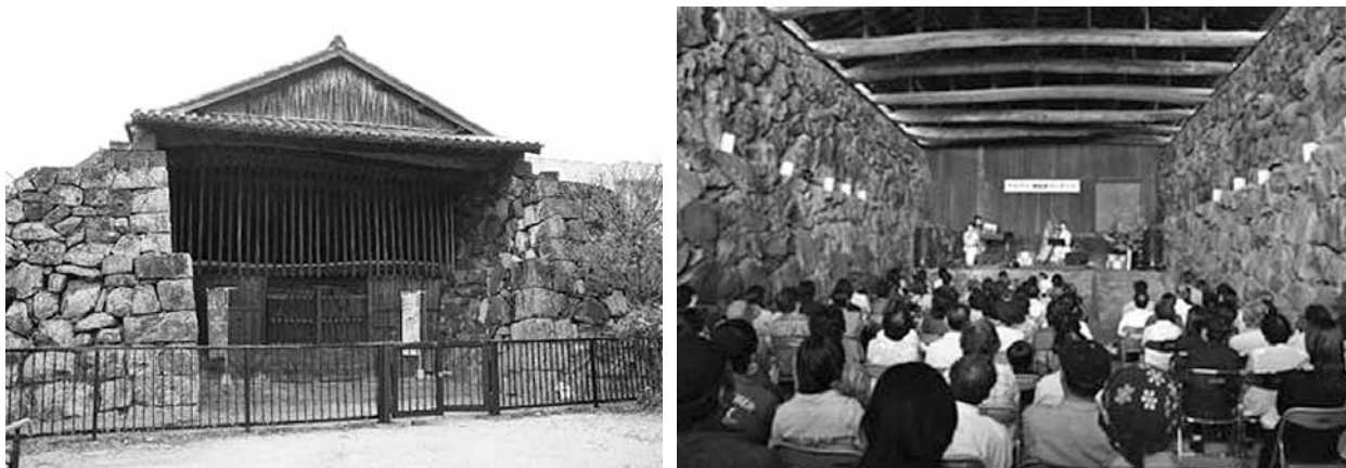
Рис. 4. Старий корабельний док у припортовому кварталі Хамамацу-чо у Хагі

Існують також і унікальні місцеві креативні заходи поживлення міста. Зокрема, це створення детальних мап різних районів Хагі за активної участі місцевих мешканців, які вмщують у цих картах історії про цікаві місця свого району або відшукують та позначають місцеву цінну архітектуру. Хорошим прикладом є знахідка мешканцями району Хамамацу-чо старовинного корабельного доку періоду Едо, побудованого кланом Морі, та згодом забутого (рис. 4), який зараз спільними зусиллями мерії та громади було реставровано та пристосовано під зал для невеликих концертів. Користуються популярністю також і організовані мерією екскурсії містом з використанням старовинних мап періоду Едо, якими у наш час в Хагі можна керуватися практично без поправок.