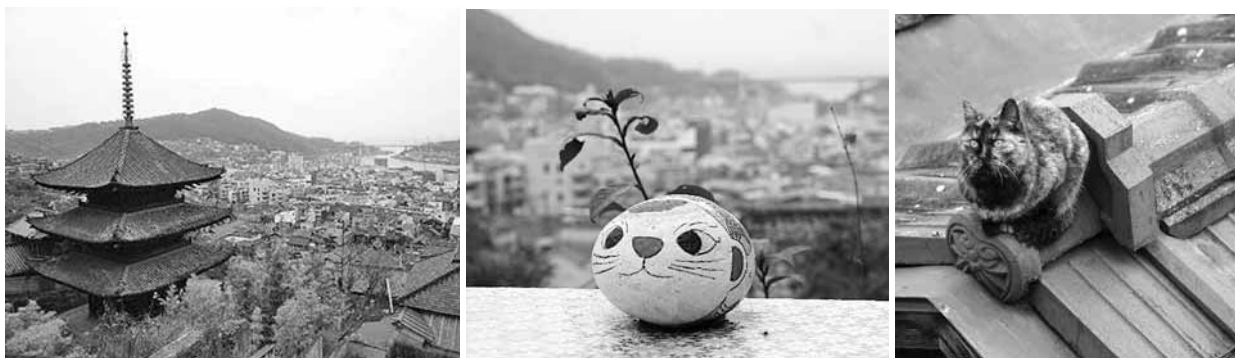
Рис. 5. Коти в просторі Ономічі (проєкт Ономічі Іхатов)