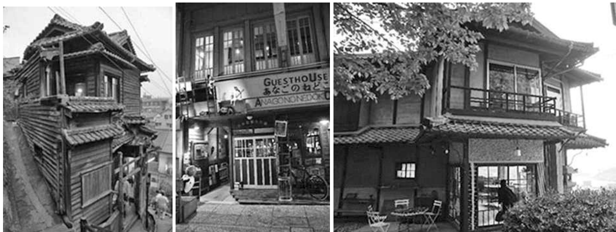
Рис. 6. Відроджені будинки проекту Акія Сайсей : Ономічі Гауді , Анаго-но-Недоко , Міхараші-тей