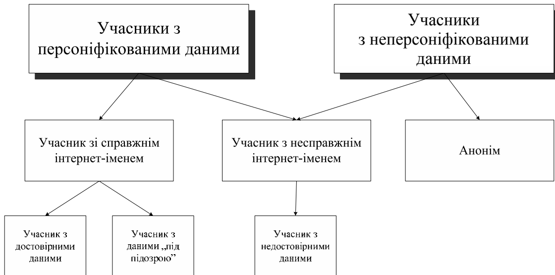
Рис. 2. Класифікація учасників веб-спільнот з урахуванням персоніфікації наданих даних

Реєстраційна форма веб-спільнот передбачає подання необхідних даних про учасника для його ідентифікації у спільноті. На рис. 2 зображено класифікацію учасників освітніх веб-спільнот з урахуванням персоніфікації наданих даних.