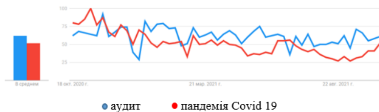
б) частота застосування термінів «аудит», «пандемія Covid-19» в світі, 2020-2021рр. (складено авторами за даними Google Trends )