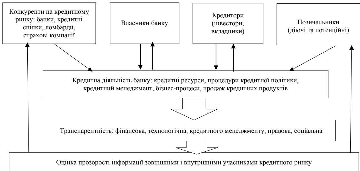
Рис. 2. Вплив учасників кредитного ринку на рівень прозорості кредитної діяльності банків

Зазначене вище стало підґрунтям для визначення напрямів впливу різних учасників кредитного ринку на процеси формування транспарентності кредитної діяльності банків (рис. 2).