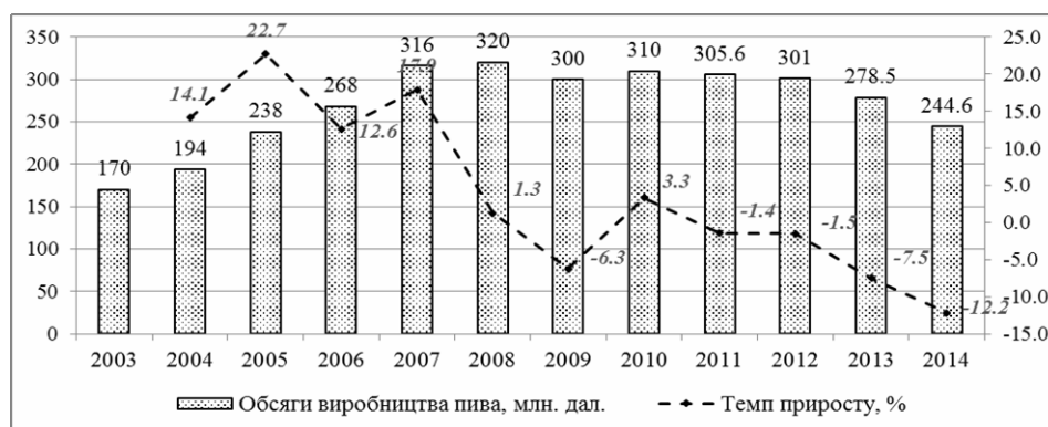
Рис. 2. Динаміка обсягів виробництва пива в Україні протягом 2003–2014 рр.

Така ситуація на ринку пива пов'язана з: