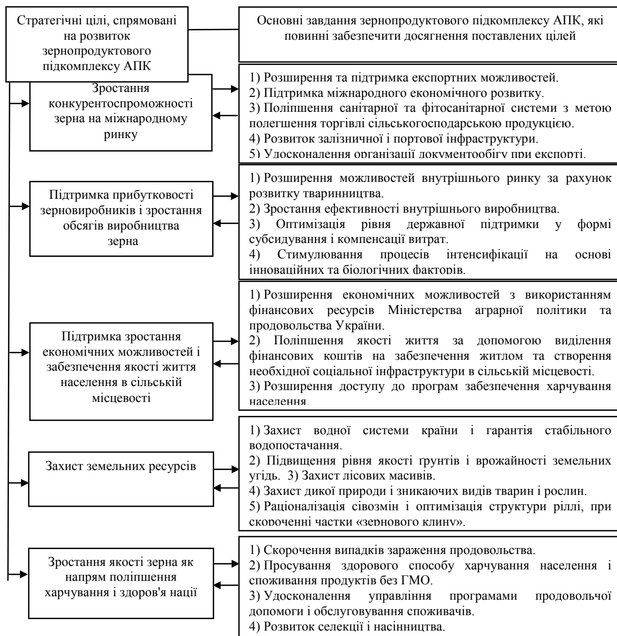
Рис. 1. Стратегічні цілі і завдання розвитку зернопродуктового підкомплексу АПК

інфраструктури. Виходить, що на даний момент підприємницькі структури не можуть інтенсивно наростити величину виробничих факторів, ні держава стимулювати це за рахунок прямої фінансової підтримки на увазі зростання дефіциту бюджету. Тому формування стратегічних цілей і супутніх їм завдань повинно виходити з поточних реалій і можливостей економіки країни і конкретно зернопродуктового підкомплексу АПК [3].