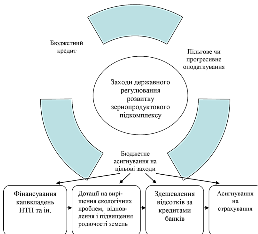
Рис. 3. Система заходів державного регулювання розвитку зернопродуктового підкомплексу

Державне регулювання сільського господарства (у тому числі і зернової галузі) доцільно проводити за наступними позиціями: підтримка загального рівня доходності в галузі і стимулювання платоспроможності населення; антимонопольне регулювання і регулювання пропорції всередині і міжгалузевого обміну; сприяння розвитку ринкової інфраструктури; підтримка стабільної, сприятливої кон'юнктури на ринку через проведення політики протекціонізму і забезпечення умов для конкуренції з зовнішнім ринком; розширення практики страхування інвестиційних проектів, які підтримуються державою; залучення іноземних інвестицій, технічної і технологічної підтримки. Система заходів державного регулювання розвитку зернопродуктового підкомплексу показана на рис. 3.