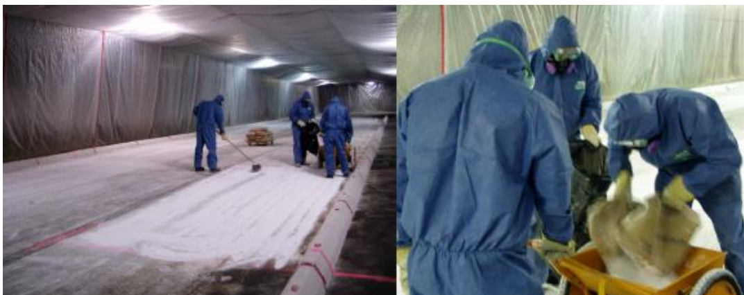
Рис. 2. Захисне обладнання, необхідне для тестування за PM_{10} and PM_{2,5} Street Sweeper Efficiency Test Protocol [15]

У [15] у якості вимог до тестового матеріалу при випробуваннях машини з вакуумним підбором було прийнято, що це мають бути тверді частинки аеродинамічним діаметром менше 10 мкм, які позначались як PM_{10} . А також частинки, що мають аеродинамічний розмір менший за 2,5 мкм позначені як PM_{2,5} . Для імітації забруднення використовувався наповнювач для фарби з середнім діаметром 3 мкм. У той же час використання таких дрібнодисперсних матеріалів для тестування викликає низку ускладнень, наслідком яких є необхідність застосування як засобів особистого захисту так і захист від можливого впливу на результати випробувань факторів навколишнього середовища, рис. 2.