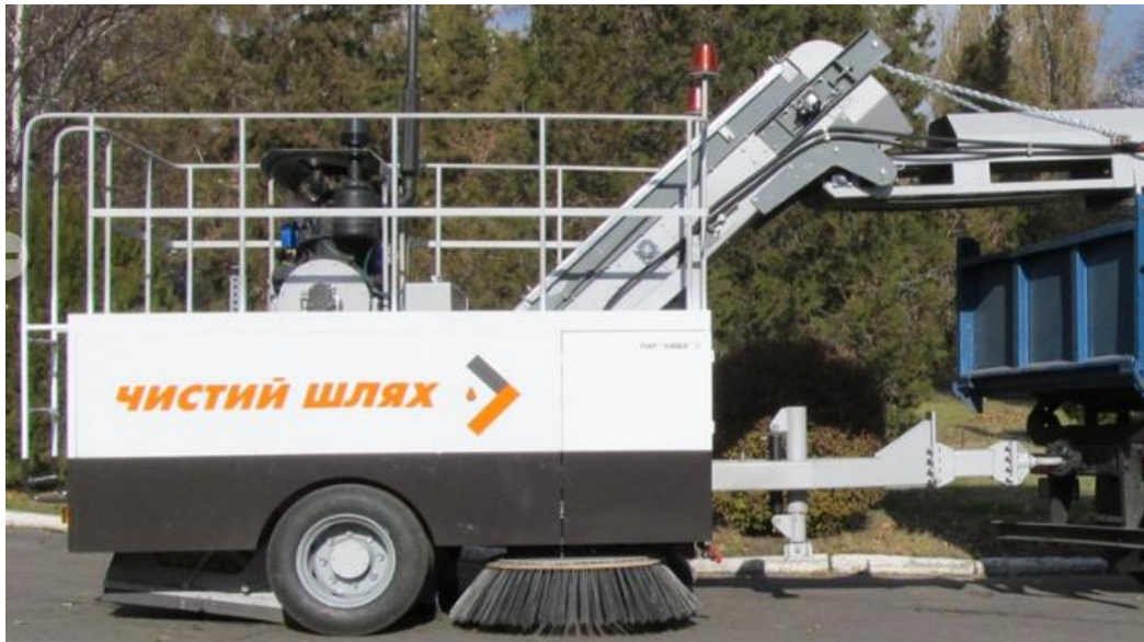
Рис. 1. Зовнішній вигляд щіткової ППМ КВСЗ-4002 «Чистий шлях» [6]

Найбільш складним є визначення коефіцієнта ефективності підмітання, оскільки отримане під час дослідів значення суттєво залежить від таких чинників, як: