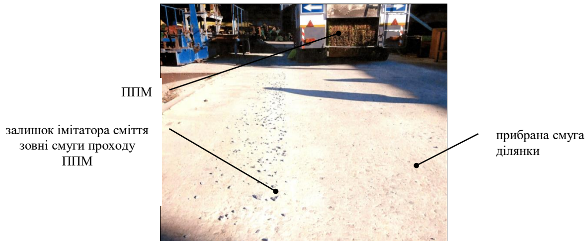
Рис. 4. Вигляд тестової ділянки після проходу ППМ

І саме після такого проходу (рис. 4) дуже зручно вимірювати ширину полоси прибирання машини (між двох бічних смуг с залишками сміття-імітатора).