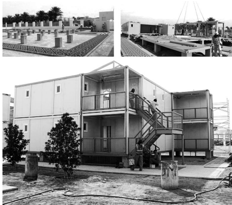
Рис. 2. Пропозиція катарського парку науки та техніки (QSTP) й університету Virginia Commonwealth University, Катар (VCUQatar) [4].

В основу зазначеного проекту було покладено прагнення авторів реалізувати нову концепцію сталої соціальної моделі спеціалізованого житла. Таке рішення в плануванні базується на використанні модулів, котрі в поєднанні створюють житлове утворення з досить динамічними властивостями – за потреби площу, структуру й конфігурацію можна змінювати (так усе базується на використанні портативних модулів) (рис. 2).