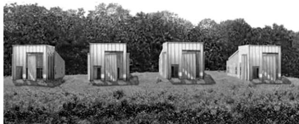
Рис. 1. Пропозиція Браяна Файнокі [3].