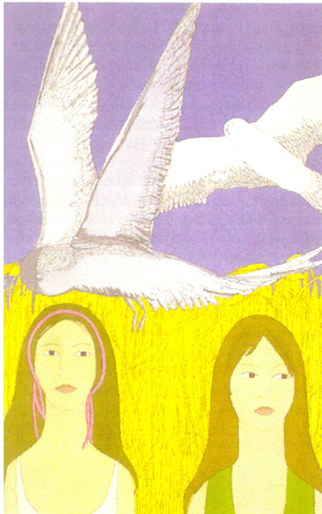
Птахи і дівчата. 1970 р.