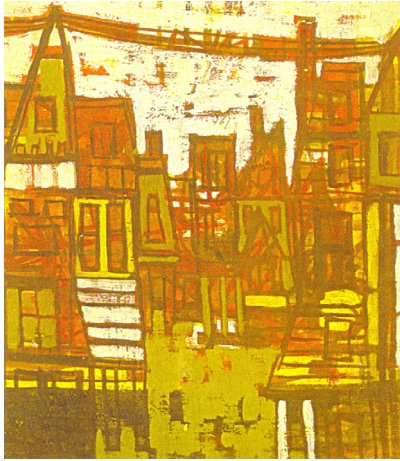
Будинки. 1958 р.