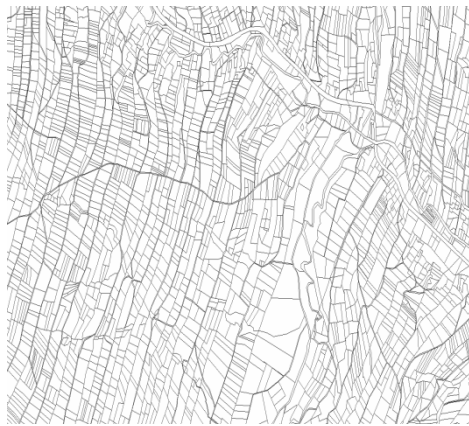
Рис. 1. Стрічково-драбинкове та нерегулярне розташування ділянок.* *Джерело: [4].

Однією з основних проблем у Польщі є роздроблення індивідуальних землеволодінь селян, що негативно впливає на організацію та рівень сільськогосподарського виробництва. Земельні господарства часто розташовуються в шаховому порядку, термін цей використовують для опису розсіяння окремих ділянок землі між ділянками інших господарств (Styś, 1939). Через великі відстані, що ділять землі власника, збільшуються транспортні витрати, тим самим знижуючи доходи фермерів (Leń, 2012).