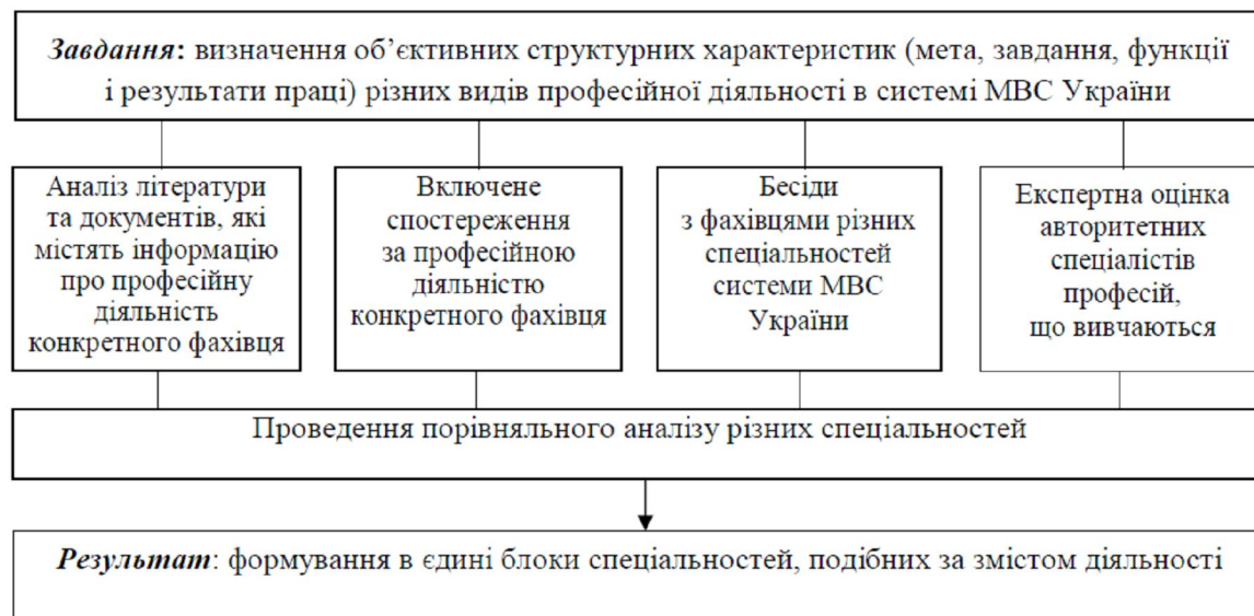
Рис. 1. Попередній етап системно-структурного моделювання професійної діяльності фахівців різних спеціальностей системи МВС України

Аналіз професійної діяльності конкретного фахівця МВС України свідчить, що залежно від умов її виконання у ній розрізняються два періоди: повсякденна діяльність у звичайних умовах та виконання завдань за призначенням в екстремальних умовах.