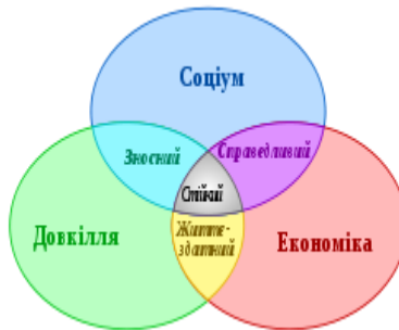
Рис. 1. Триєдина концепція стійкого розвитку

Концепція стійкого розвитку регіону об'єднує три основні точки зору: економічну, соціальну та екологічну (рис. 1).