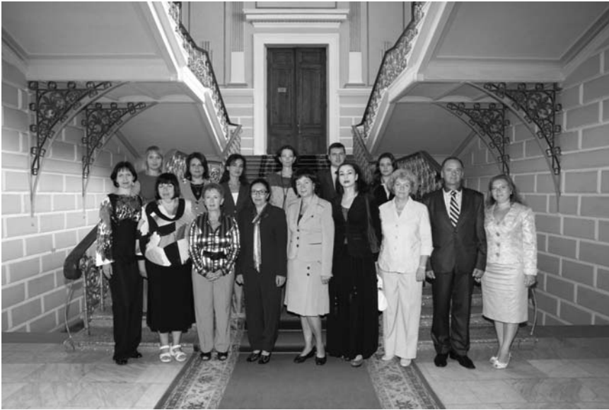
Колектив кафедри економічної теорії (2013 р.)

Історія кафедри тісно пов'язана зі створенням Імператорського Харківського університету та його юридичного факультету. У 1804 р. університетським статутом було затверджено кафедру «дипломатики і політичної економії», а в 1835 р. у складі Імператорського університету було створено окрему кафедру політичної економії. Однак як самостійний навчальний підрозділ Харківського юридичного інституту кафедра політичної економії функціонує з 1944 р. У 1991 р. кафедра стала називатися кафедрою економічної теорії.