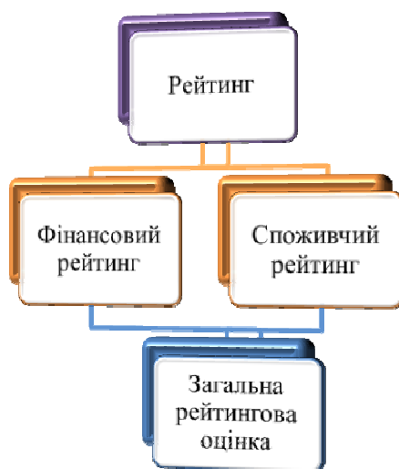
Рис. 1. Складові узагальнювальної рейтингової оцінки

На основі вище сказаного було розроблено методика яка б враховувала як фінансові так і споживчі показники. Сутність даного підходу зображена на рис. 1.