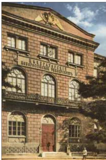
Ил. 1. Новороссийский университет (вторая половина XIX в.)

В научных кругах Одессы к середине XIX в. сложились определенные традиции в изучении юга страны, в которых во многом задавала тон деятельность одного из первых в стране научных обществ – Одесского общества истории и древностей (1839). Традиции эти были закреплены открывшимся Новороссийским университетом, перед которым еще при его основании прямо выдвигалась задача крупномасштабных краеведческих изысканий (ил. 1). Особая роль в таких исследованиях принадлежала первым обобщениям по истории отдельных учреждений края и самого Новороссийского университета. В числе этих обобщений особняком стоят работы, подводившие итог его деятельности в разные годы истории университета и написанные по поводу очередных его юбилеев (ил. 2). За полуторастолетнюю деятельность Одесского университета накопился достаточно солидный арсенал подобных