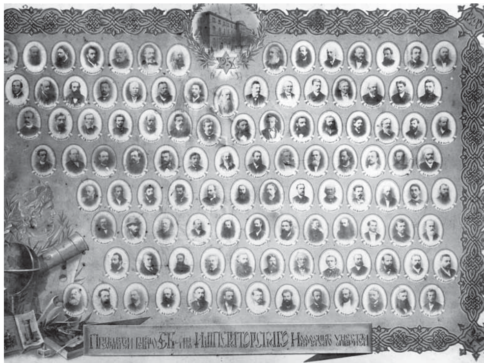
Ил. 15. Виньетка с фотографиями преподавателей