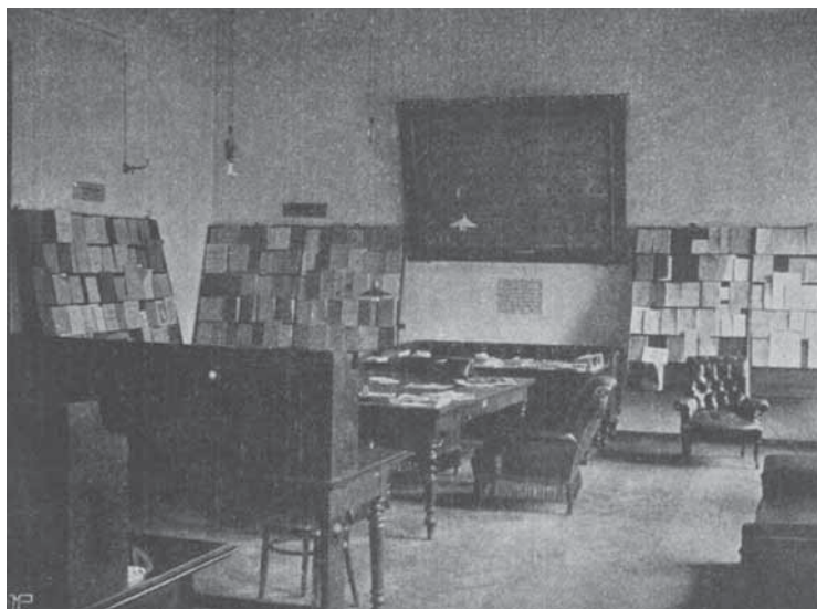
Ил. 18. Журнальная лектория в университетской библиотеке

пия виньетки, напечатанной в качестве приложения к работе А. И. Маркевича «25-летие Императорского Новороссийского университета» (ил. 18). К сожалению, этот большой стенд до нашего времени не сохранился.