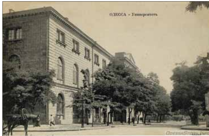
Ил. 2. Новоросійський университет (конец XIX в.)

работ 1 . В концептуальном плане каждая из них была насквозь пронизана духом своего времени.