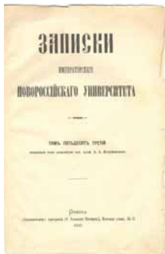
Ил. 14. Записки Новоросійського університету. Т. 53 (1890)

53-й том этого журнала и отдельным тиражом, как самостоятельное издание, в одесской типографии «Экономическая» (ил. 14).