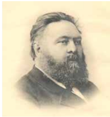
Ил. 6. А. И. Маркевич (1890-е гг.)

сочинения о Московском государстве XVII в., в которой собраны важные данные для изучения государственной и общественной жизни допетровской Руси [5].