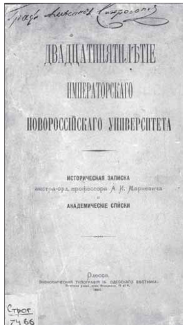
Ил. 3. Маркевич А. И. 25-летие Новоросійського университета. Ист. записка и академические списки (Одесса, 1890)

Некоторые из них были подвержены жесткому критическому анализу с точки зрения истории и историографии Одесского национального университета имени И. И. Мечникова 2 .