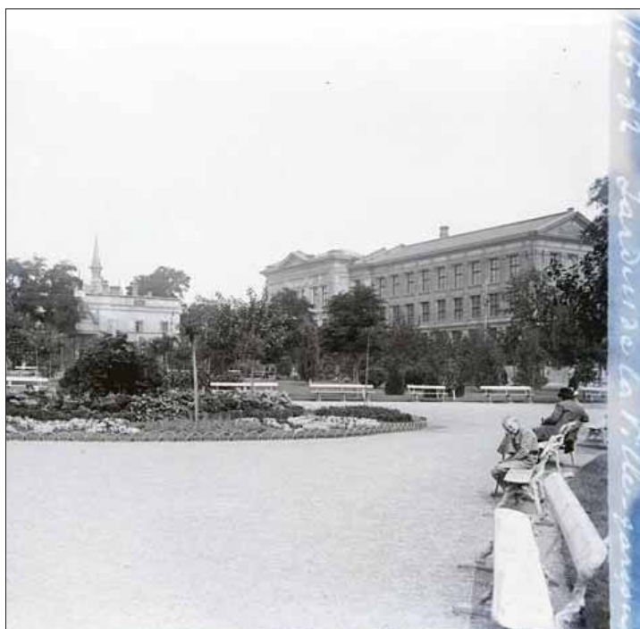
Ил. 17. Городской сад