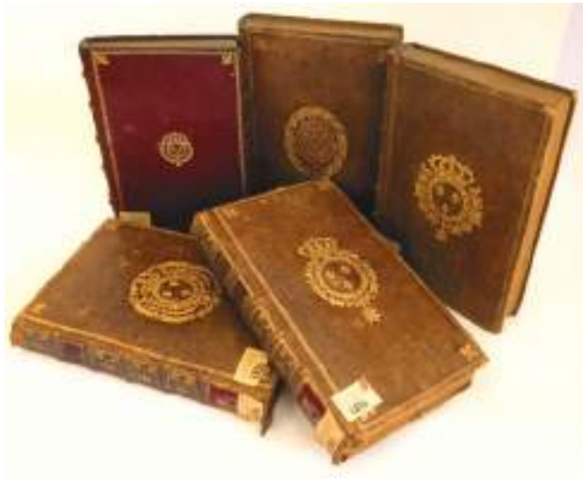
Ил. 4. «Королевские альманахи» с гербом «De France»