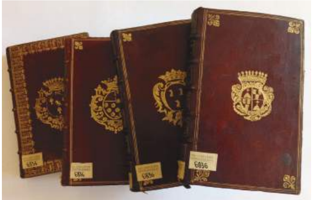
Ил. 6. «Королевские альманахи» из французских дворянских книжных собраний (на переднем плане – экземпляр с гербом семьи Дюре де Соруа)