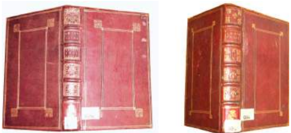
Ил. 7а-7б. Переплёты «Королевских альманахов» в стиле Дюсея