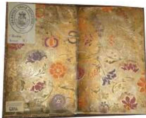
Ил. 10а-10б-10в. Форзацы переплётов экземпляров «Королевского альманаха»