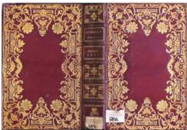
Ил. 8а-8б-8в. Переплёты «Королевских альманахов», изготовленные в мастерской П.-П.Дюбюиссона