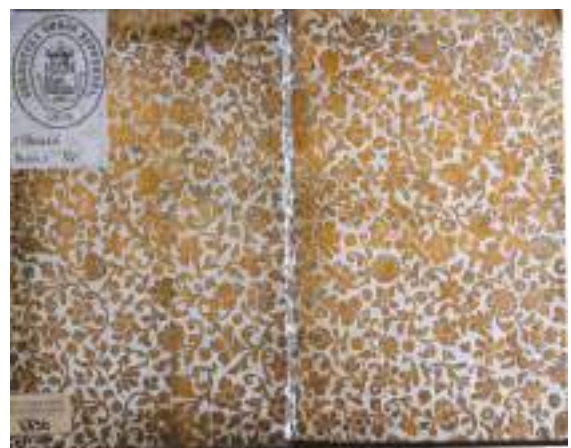
Ил. 9а-9б-9в. Форзацы переплётів екземплярів «Королевского альманаха»