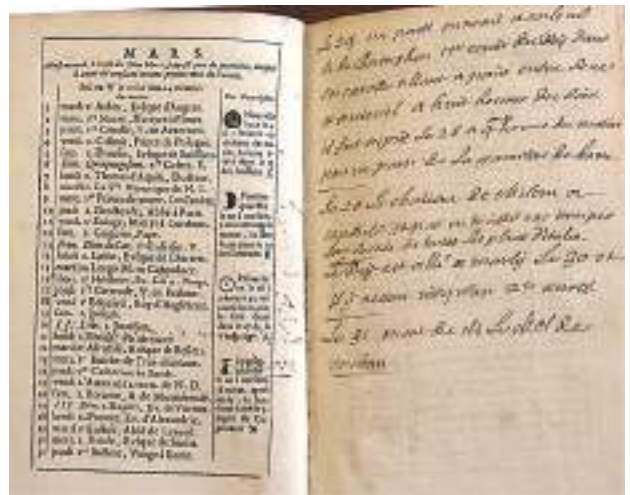
Ил. 2а. «Королевский альманах» на 1707 год. Записи на пустом листе (март)