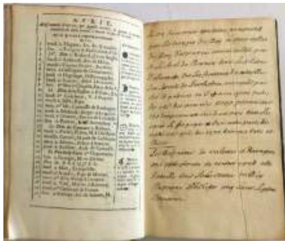
Ил. 2б. «Королевский альманах» на 1707 год. Записи на пустом листе (апрель)