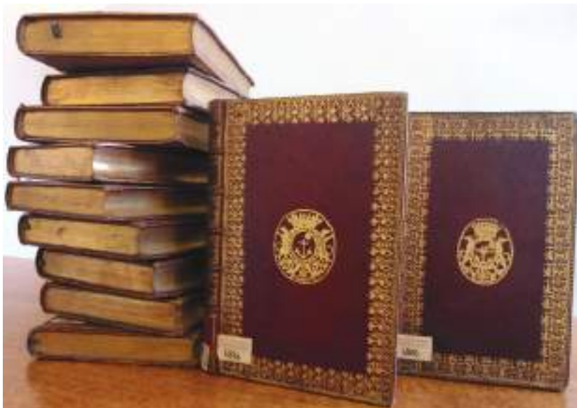
Ил. 5. «Королевские альманахи» с суперэклибрисами Самюэля-Жака Бернара де Кубера и Габриеля Бернара де Риё