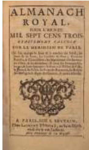
Ил. 1. «Королевский альманах» на 1703 год. Титульный лист