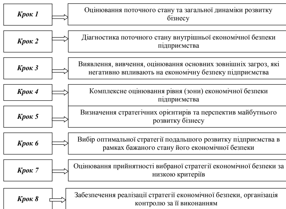
Рис. 1. Процес розроблення стратегії економічної безпеки підприємства

Загрози, які містить зовнішнє середовище діяльності підприємства, можна ідентифікувати як загрози об'єктивного та суб'єктивного характеру. Об'єктивними загрозами вважають негативну дію будь-яких макроекономічних факторів (фаза економічного циклу, динаміка економічного зростання, рівень інфляції, валютні курси,