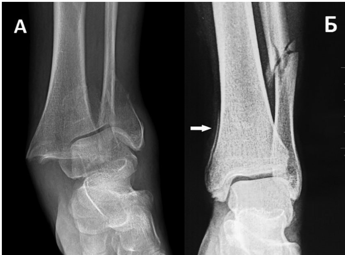
Рис. 1. Рентгенограми пацієнта з переломом ЗКВГК. А – “double dome” симптом; Б – “flake fragment sign”, “spur sign” симптом

низьку інформативність та надійність традиційної рентгенографії у пацієнтів із переломом ЗКВГК [19, 20]. На сьогодні комп'ютерна томографія (КТ) залишається “золотим стандартом” діагностики переломів ЗКВГК та має ряд переваг у порівнянні з рентгенографічним методом, який часто призводить не лише до недооцінки, а іноді й перебільшення тяжкості травми ГС [21]. S. Donohoe та ін. показали, що результати КТ є причиною зміни хірургічної тактики щодо стабілізації переломів ЗКВГК майже у 44% випадків у порівнянні з традиційними рентгенограмами [22]. Згідно з класифікацією Arbeitsgemeinschaft für Osteosynthesefragen / Orthopaedic Trauma Association (AO / OTA), комп'ютерна томографія рекомендована за наявності вертикального перелому медіальної кісточки, переломах типу 44B з ушкодженням ЗКВГК та всіх переломах типу 44C [23]. КТ, особливо у поєднанні з 3D-реконструкцією, допомагає визначити не лише морфологію та просторове розміщення перелому ЗКВГК, а й ступінь ушкодження суглобового плато ВГК та ушкодження ДМГС, що є надзвичайно важливими умовами при плануванні хірургічного лікування [24]. Незважаючи на те, що переважна більшість авторів вважає, що застосування рентгенографії втратило значущість через широке застосування комп'ютерної томографії, важко не