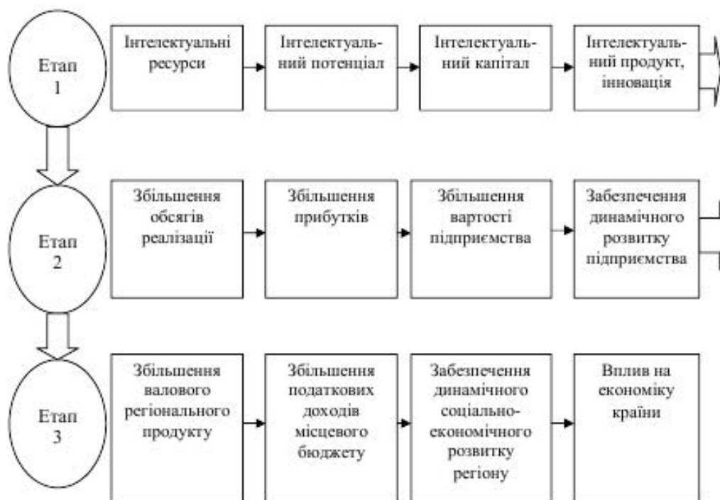
Рис. 1. Місце інтелектуального потенціалу у соціально-економічному розвитку регіону

Якісні характеристики інтелектуального потенціалу регіону формуються під впливом освіти. Ринкові трансформації суттєво знизили якість освітньої діяльності. Освіта пов'язана з надмірною комерціалізацією, особливо вища, яка в Україні скромно трактується як введення оплати за освітні послуги. Що стосується «контрактників», то навіть для державних навчальних закладів вони сьогодні є важливим джерелом їх існування. За таких умов вимоги до знань учнів і студентів стають другорядними у порівнянні з фінансовими потребами [6].