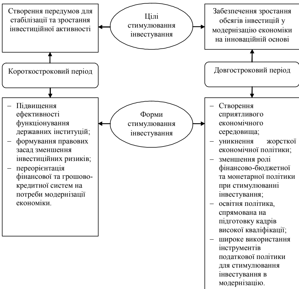
Рис. 3. Цілі та форми стимулювання інвестування в модернізацію на інноваційній основі

Застосування фінансово-бюджетної політики має узгоджуватись із структурною так, щоб не провокувати негативних наслідків як для інвесторів, так і для економіки держави. В тому числі може передбачатись зменшення ролі фінансово-бюджетної та монетарної політики в стимулюванні інвестування. Так, необхідність утримання державного боргу стримуватиме інвестування, однак дозволить здійснити структурні перетворення. Монетарне стимулювання збільшить можливості до інвестування, однак зменшить можливості бюджетної політики, що викличе нестійкість економіки під час циклічного спаду.