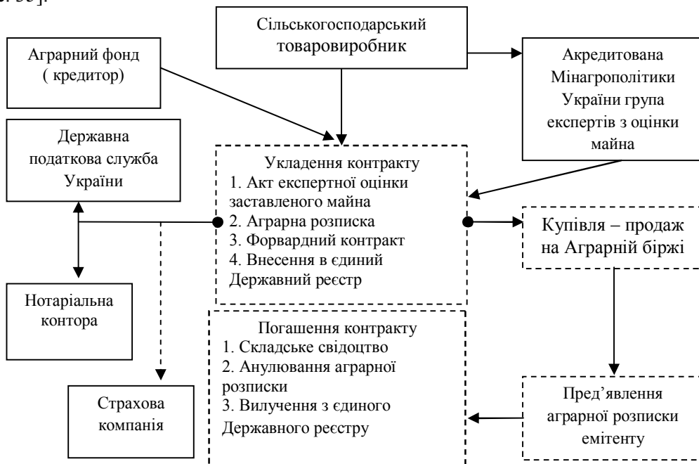
Рис. 2. Схема механізму функціонування аграрних розписок в Україні

- запровадити механізм обігу аграрних розписок, що дасть змогу товаровиробникам одержати завдяки цьому фінансовому інструменту готівкові кошти за рахунок кредитування під заставу майбутнього урожаю та власного майна. З одного боку, це підвищить ефективність довгострокового планування господарської діяльності, а з іншого, – знизить ризик щодо непоставки продукції [1, с. 35].