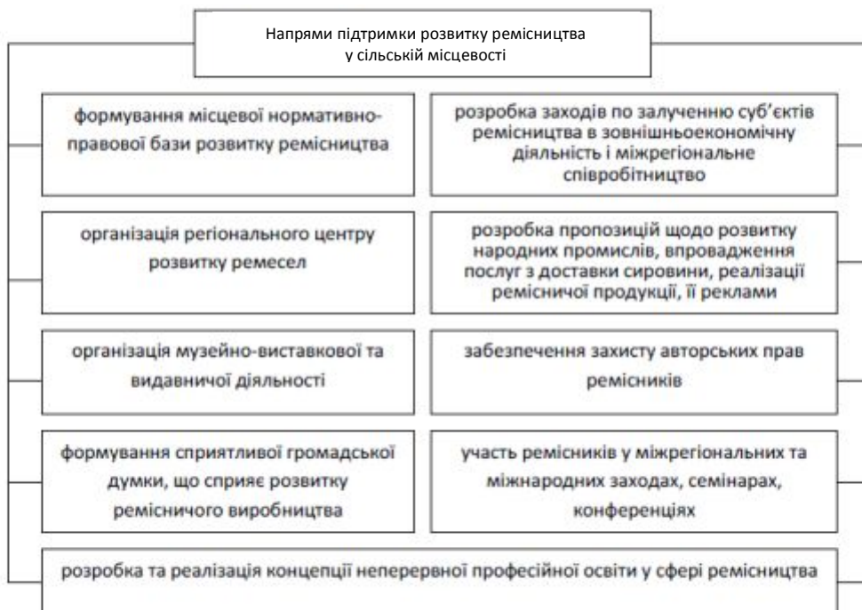
Рис. 3. Напрями підтримки розвитку ремісництва у сільській місцевості

Виходячи із завдання гармонізації головних складових ремісничої діяльності – науки, виробництва, творчості та кадрів – основними шляхами розвитку ремісничої діяльності у регіоні є такі (рис. 3).