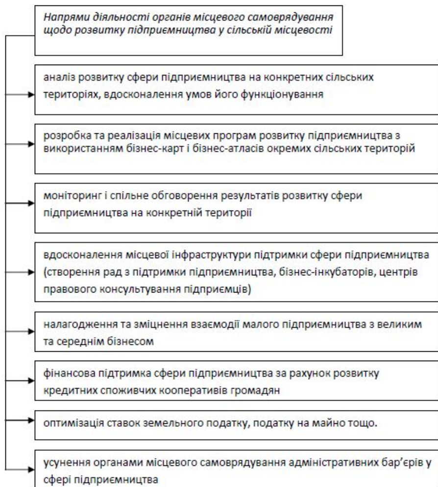
Рис. 1. Напрями діяльності органів місцевого самоврядування щодо розвитку підприємництва у сільській місцевості

Перспективи активізації розвитку підприємництва у сільській місцевості пов'язуються з необхідністю визначення пріоритетних напрямів взаємодії суспільства, органів державної влади та сфери підприємництва. Проведене дослідження дозволяє стверджувати, що в сучасних умовах є такі напрями (рис. 2).