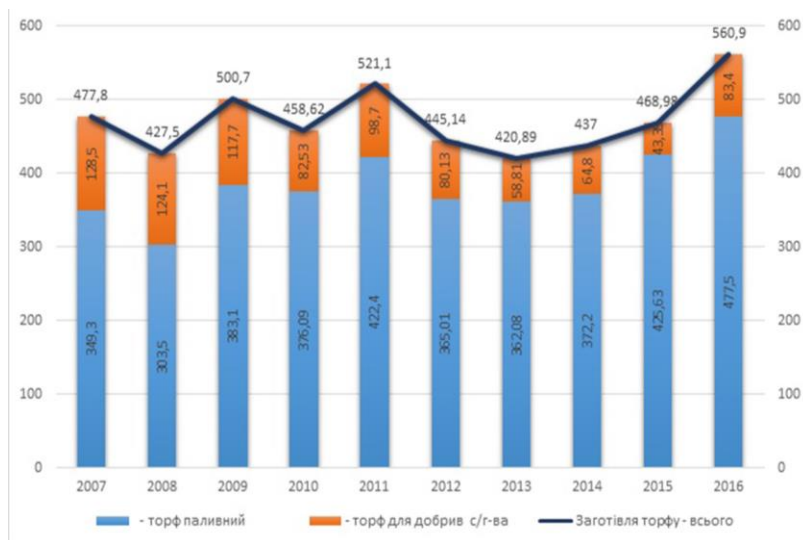
Рис. 1. Видобуток торфу підприємствами Державного концерну «Укрторф» 2007–2016 рр., тис. т.

близько 936,1 млн т [3]. За останні десять років рівень видобутку торфу коливався у межах 420, – 521,1 тис. тонн, мало коливаючись до 2013 року (рис. 1). І лише за останні роки намітилася тенденція росту видобування торфу, що обумовлено збільшенням споживання паливного торфу. При цьому, використання торфу в сільському господарстві в якості добрив постійно знижувалося, склавши у 2015 році лише 43,3 тис. тонн. Торф використовується наразі переважно для виробництва субстратів, стимуляторів росту рослин і практично не використовується для удобрення відкритого ґрунту. Це великий резерв, на який варто звернути увагу.