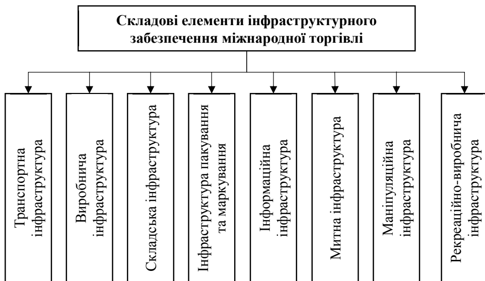
Рис. 2. Елементи інфраструктурного забезпечення міжнародної торгівлі