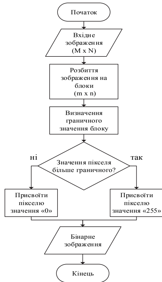
Рис. 1. Функціональна схема алгоритму бінаризації

2) запропонована модель маскування видових зображень дозволяє підвищити ефективність обробки та стиснення зображення на борту БПЛА що, в свою чергу, підвищує оперативність і достовірність обробки розвідувальної інформації без втрати роздільної здатності знімка та використовуючи наявні зараз канали передачі даних.