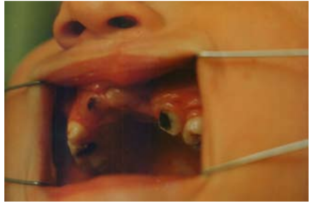
Рис. 7. Стан альвеолярного паростка через рік після перенесеної операції уранопластики.

ли утворення втягнутого грубого рубця, що створювало його макроанатомічну структуру та створювало умови для повільного росту, який помітно відставав, порівняно з неушкодженою протилежною стороною, що в перспективі відображалось на косметичному та функціональному стані цієї ділянки (рис. 7).