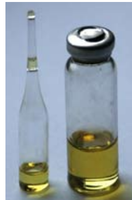
Рис. 2. Фото компонентів медичного клею КЛ-3.

Нами було запропоновано новий комплексний остеогенний трансплантат, адаптований для пластики таких специфічних дефектів, як вроджені незрощення альвеолярного паростка верхньої щелепи, які характеризуються вузькою, але доволі глибокою щілиноподібною формою. Він виготовляється безпосередньо під час оперативного втручання та містить дрібні смужки