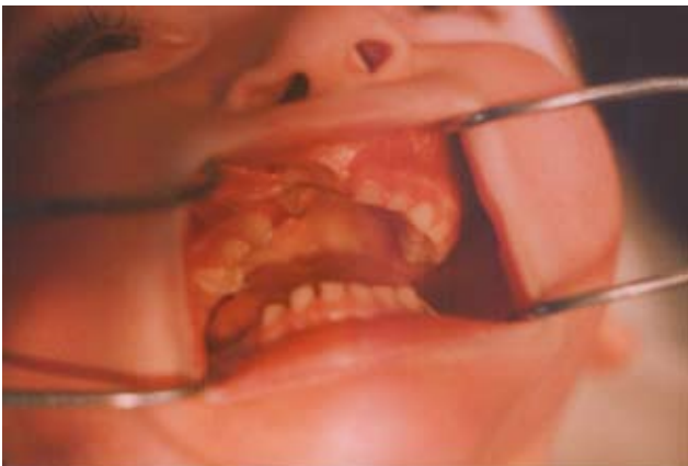
Рис. 6. Стан альвеолярного паростка через рік після перенесеної операції ураноостеопластики.

Схожа клінічна ситуація спостерігалася і в ділянці альвеолярного паростка. У хворих, яким була проведена ураноальвеолоостеопластика, деформація альвеолярного паростка була практично відсутня. Загоєння рани у всіх випадках проходило первинним натягом, у жодному випадку не було виявлено ніяких ускладнень. Альвеолярний паросток був безперервним, пересінок сформованим, вільним, в ділянці рани виявлявся ніжний рубець (рис. 6). Завдяки цьому формувалися добрі умови базису для крила носа та розвитку верхньої губи, а тому віддалені косметичні та функціональні наслідки були значно кращими та стабільними.