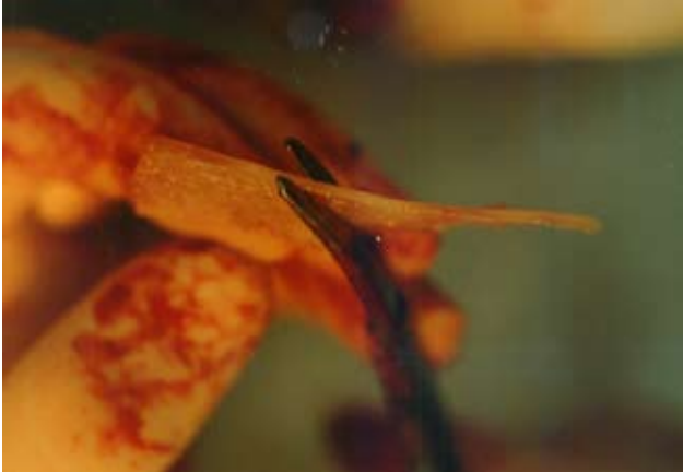
Рис. 3. Моделювання кісткового трансплантата за допомогою хірургічних ножиць.