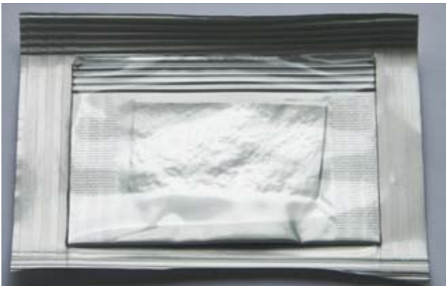
Рис. 1. Фото запакованого у стерильний пакет демінералізованого кісткового трансплантата.

Іншим компонентом, який використовували при виготовленні запропонованого композиційного остеотрансплантата, був медичний клей КЛ-3 на основі поліуретану, синтезований в інституті хімії високомолекулярних сполук Академії наук України. До його складу входять клейова основа та прискорювач полімеризації (рис. 2).