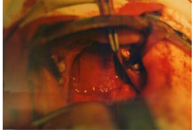
Рис. 4. Змодельований остеотрансплантат, розміщений в ділянці вродженого дефекту твердого піднебіння.

Кісткову пластику не застосовували при дефекті твердого піднебіння довжиною менше за 0,5 см, при відсутності порушень мови, відхилення у розвитку верхньої щелепи і середнього відділу глотки.