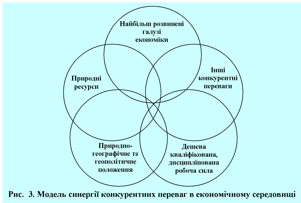
Рис. 3. Модель синергії конкурентних переваг в економічному середовищі

При розробленні мобілізаційних програм розвитку економіки пріоритетного значення слід надати програмам, направленим на взаємний розвиток науково-технічного та виробничого потенціалів країни, особливо в оборонно-промисловому комплексі, який характеризується наявністю найбільш передових технологічних досягнень, потужними науковим та виробничим потенціалами, та зовнішніми маркетинговими зв'язками.