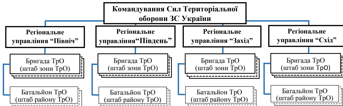
Рис. 2. Організаційна структура Сил територіальної оборони Збройних Сил України

Законодавством України визначено організаційну структуру СТрО (рис. 2), та порядок їх формування. Одним із принципів, на яких ґрунтується територіальна оборона є територіальність, яка передбачає формування бригади та батальйону СТрО в межах адміністративного поділу України, а органів військового управління – у межах військово-адміністративного поділу України. Тобто бригада СТрО як форма організації створюється в зоні ТрО, яка відповідає адміністративній одиниці області, а батальйон СТрО – адміністративній одиниці району в межах області [6].