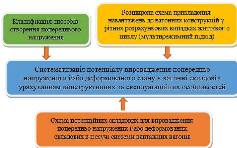
Рис. 1. Графічний вигляд взаємозв'язку між складовими

ний підхід) та потенційних складових для впровадження попередньо напружених і/або деформованих складових в несучі системи вантажних вагонів. Описане вище зручно подати в графічному вигляді (рис. 1).