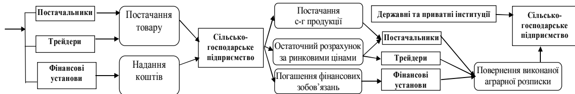
Рис. 1. Етапи здійснення позикових операцій з використанням аграрних розписок.*