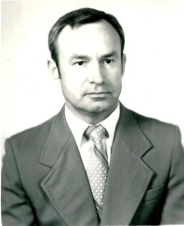
Проф. Є.І. Буряк

Упродовж 1969–1985 рр. кафедрою завідував доц. А. В. Демченко. У 1974 р. він захистив докторську дисертацію «Теоретичне обґрунтування та узагальнення досвіду ліквідації бруцельозу сільськогосподарських тварин на півдні України». У ці роки на кафедрі проводилися дослідження, спрямовані на вивчення ефективності кормових антибіотиків, мікробного бета-каротину та інших преміксів; кількісного і якісного складу травного тракту свиней і великої рогатої худоби за умови різних режимів вирощування і відгодівлі; методів серологічної діагностики інфекційних хвороб птиці й ефективності сироватки перехворівших тварин для подальшого лікування та профілактичних заходів у випадку змішаних інфекцій у птиці. Курс вірусології на кафедрі читав доц. О. Л. Барабаш, а згодом — доц. М. Г. Кондратюк.