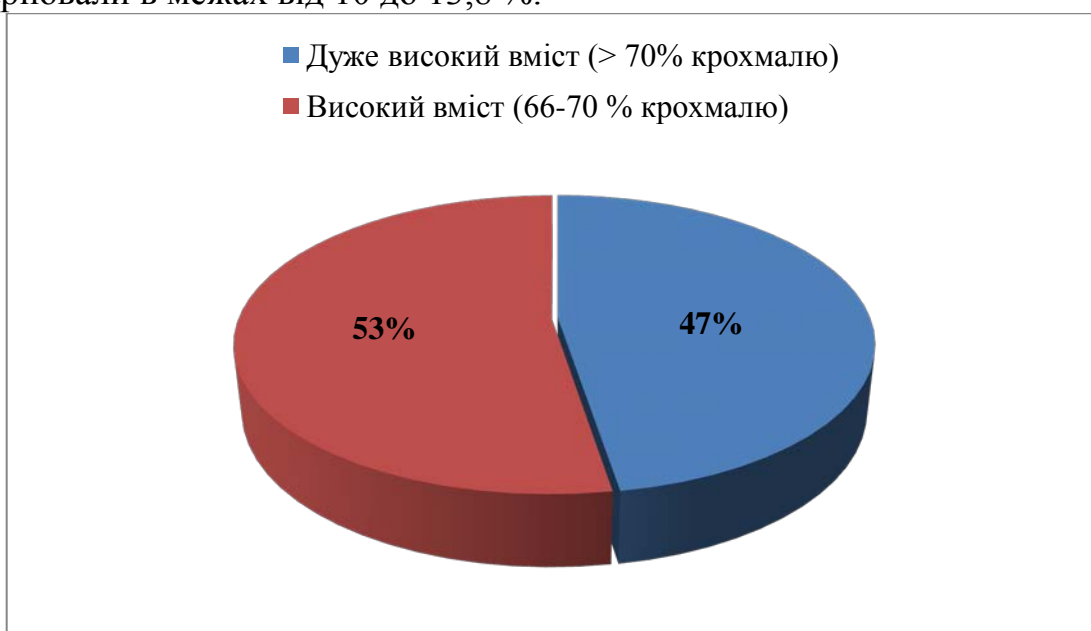
Рис. 2. Розподіл зразків колекції за відсотковим вмістом крохмалю, 2019 р.

14 із 38 ліній характеризувались високим вмістом білка, а 24 лінії – середнім вмістом. До групи із високим вмістом білка увійшли лінії: АЕ 464, АЕ746, АЕ 801, G 255, УХК 669, НЛГ 1239, ВК 13 та ін. В загальному показники вмісту білка варіювали в межах від 10 до 13,8 %.