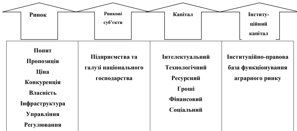
Рис. 2. Алгоритм ринкового регулювання суб'єктів аграрного ринку

господарство є відносно статичною галуззю, повільніше, ніж інші пристосовується до мінливих економічних і технологічних умов. Тому аграрний сектор України традиційно займає особливе місце серед інших галузей національного господарства, що вимагає створення додаткових інститутів впливу. Інституціональна система є базисом регулювання аграрного ринку, тому, на думку вітчизняних економістів Г.М. Калетніка, О.Г. Шпикуляка, серед компонентів ринкової перебудови одне з визначальних місць належить інституціям і механізмам регуляторної політики. Вітчизняне сільське господарство сучасного періоду характеризується низьким рівнем ефективності, якщо розглядати його результативність у площині обсягів виробництва і прибутковості, а такий аспект проблем лежить безпосередньо у площині регуляторної політики щодо ринку. Проблемність цього питання очевидна, тому адекватна оцінка інститутів і механізмів регулюван-