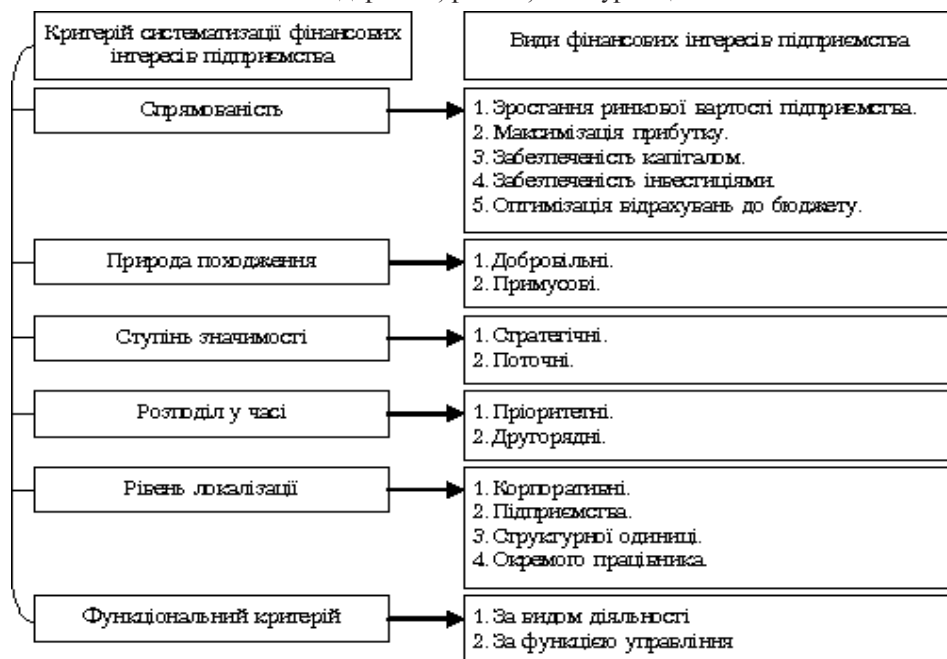
Рис. 1. Класифікація фінансових інтересів з урахуванням різних критеріїв [8]

При цьому важливо визначитися, що більше впливає на рівень фінансової безпеки підприємства – внутрішні чи зовнішні чинники. Це залежить від багатьох умов і для цього потрібно проводити аналітичні дослідження. На кожному підприємстві набір чинників і рівень впливу на фінансову безпеку буде різним. Відсутність фінансової безпеки, а інколи і низький її рівень призводить до поглинання чи банкрутства підприємства.