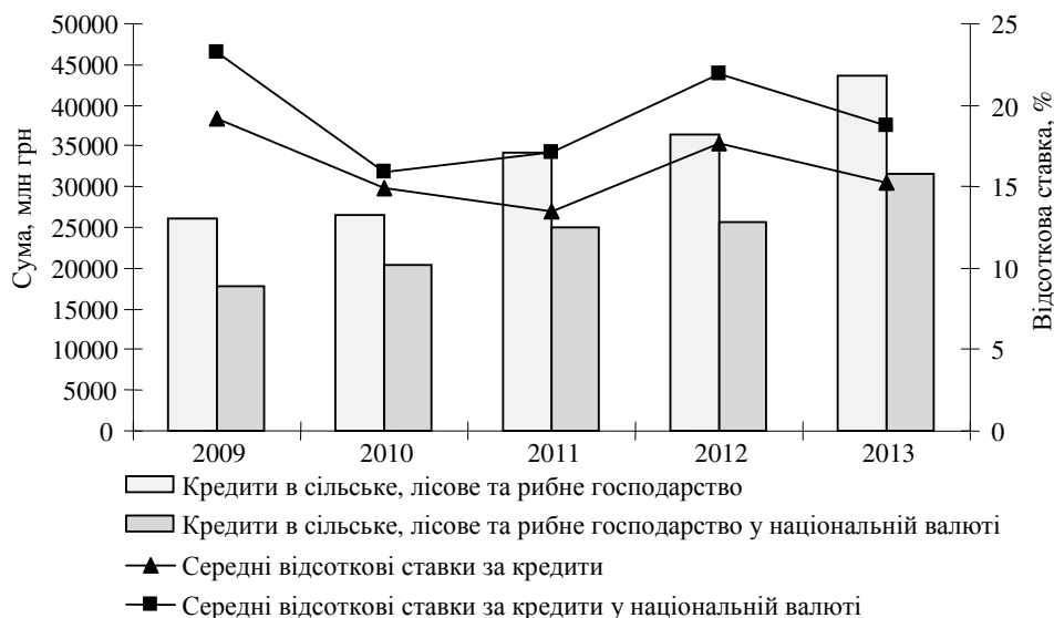
Рис. 3. Динаміка обсягів кредитування та відсоткових ставок за кредитами в сільському, лісовому та рибному господарствах, 2009–2013 рр., розраховано за даними [3]

Передбачається, що за допомогою аграрних розписок уже в перший рік запровадження товаровиробники матимуть змогу залучити 2–3 млрд грн додаткових позикових коштів, а в перспективі агросектор зможе залучити до 45–50 млрд грн на рік [2].