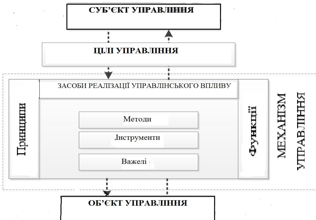
Рис. 2. Побудова механізму реалізації стратегії

двома головними причинами: перша – недоліки розроблення самої стратегії, друга – невиконання тактичних заходів щодо реалізації стратегії. Узагальнюючи досвід вивчення першої причини, треба зазначити, що стратегія має поєднати три відомі положення: по-перше, описати модель системи «як вона зараз»; по-друге, описати бажаний стан системи «як має бути» у майбутньому і, по-третє, описати механізм, завдяки якому система має переміститися із теперішнього стану в майбутнє (Рис. 1), тобто побудувати механізм реалізації стратегії (Рис. 2). Тут буде доречно прояснити відмінності між поняттями «економічний розвиток» та «економічне зростання» у відношенні до терміну «сталій».