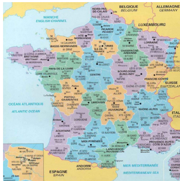
Рис. 3. Мапа регіонів та департаментів Франції

Потреба у перетвореннях територіальних кордонів локальних органів влади зумовила появу двох концепцій – функціональної та органічної – як теорій муніципального федералізму та унітаризму, відповідно. Функціональна концепція була популярною, зокрема, у Франції. Жорстка реформа кордонів адміністративних одиниць у цій країні була замінена на шлях гнучкої форми співпраці, якою стало міжмуніципальне співробітництво. Фактично внаслідок цього були створені різні види синдикатів, дистриктів та міських об'єднань. У 1980-х рр. у Франції були проведені певні реформи щодо децентралізації влади та