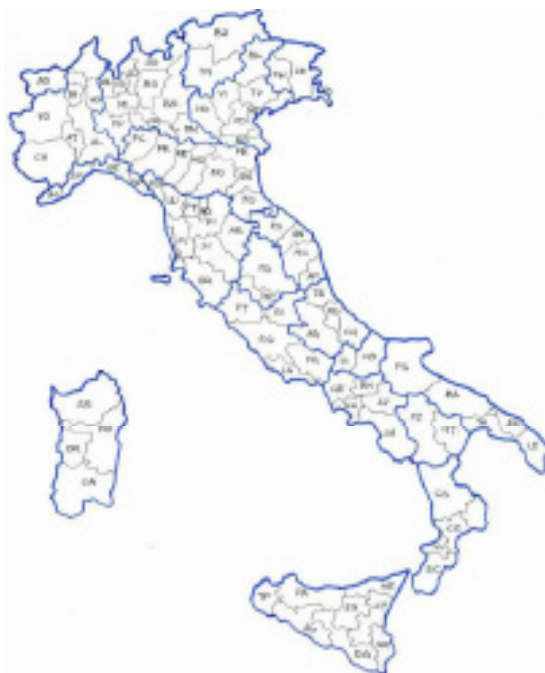
Рис. 2. Мапа регіонів та провінцій Італії

бальство. Наступний етап регіоналізації був пов'язаний із ухваленням закону про «регіональні норми щодо організації державного управління» (1975 р.), який передав значну частину державних функцій регіонам. У 1980-х рр. італійські регіони змогли вийти на загальноєвропейський рівень, що надало нові можливості для вирівнювання економічних диспропорцій регіонів, також активізувало процес перерозподілу повноважень між національною та регіональними владами та створило сприятливі консенсусні умови для наступних етапів реформ [5, с. 57-62]. В Італії адміністративний поділ складає 114 провінцій на основі кордонів 20 земель-регіонів (Абруццо, Апулія, Базиліката, Калабрія, Емілія-Романья, Лацио, Лігурія, Ломбардія, Марке, Молізе, П'ємонт, Тоскана, Умбрія, Валле-д'Аоста, Венето, Фріулі-Венеція-Джулія, Сардинія, Сицилія, Трентіно-Альто-Адідже, Кампанія).