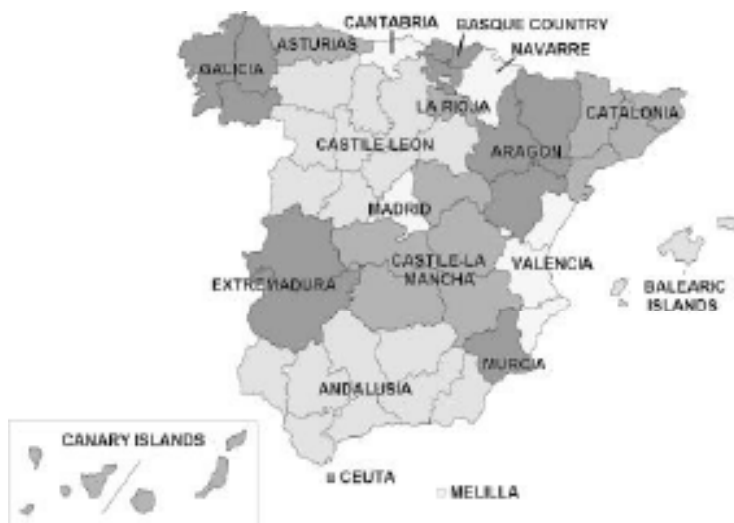
Рис. 1. Мапа регіонів та провінцій Іспанії

Фактично процес регіоналізації влади так розподіляє повноваження між центром та регіонами, які прописуються спочатку в конституції, а потім й в статутах про автономію, що створюються регіональні кластери управління в історичних регіонах-територіях на засадах регіоноцентризму, тим самим забезпечується більша децентралізація та фактичний контроль регіональною спільнотою (громадськістю) повноважень різних контролюючих органів. Тобто внаслідок асиметричної територіальної регіоналізації відбувається децентралізація влади різних органів влади, де центром ухвалення відповідних рішень стає регіон-територія, а не центр, наслідком чого стає легший моніторинг діяльності даних органів та фактично більша демократія та значніший благоустрій, що стає наслідком діяльності наново реформованих органів влади.