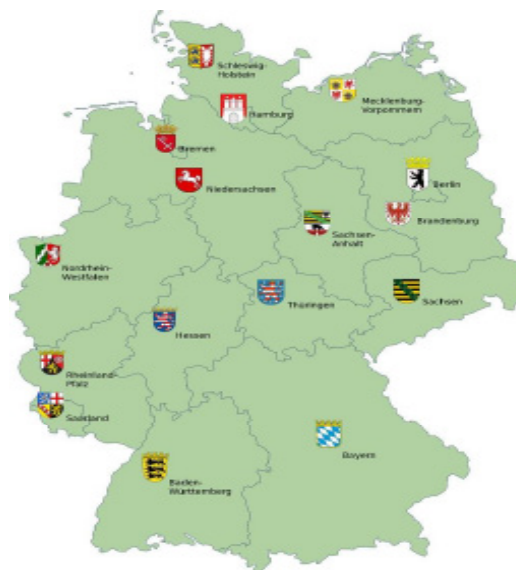
Рис. 4. Мапа земель Німеччини

У ФРН – 16 земель (Баден-Вюртемберг, Тюрингія, Баварія, Берлін, Бранденбург, Бремен, Гамбург, Гессен, Мекленбург-Померанія, Нижня Саксонія, Райн-Вестфалія, Райнланд-Пфальц, Заарланд, Саксонія, Саксонія-Ангальт, Шлезвіг-Гольштайн).