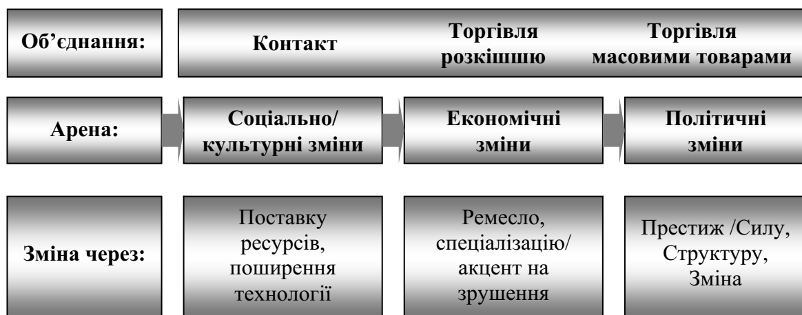
Рис. 3. Блок-схема Дж.-Д. Карлсона: арени змін, що ведуть до об'єднання [1].

Поняття мультикультурності має на увазі, що економічні й соціо-політичні зміни повинні відбутися між групами, які складаються з культурно відмінних суспільств. Це вказує на відмінності у мові, релігії, нормативних установах, способі управління та інших фундаментальних особливостях повсякденного життя. Що відбувається, коли ці суспільства взаємодіють? Для І. Валлерстайна в цьому контексті набуває першочергового значення саме структурна відмінність. Як і К. Поланьї, І. Валлерстайн ідентифікує три історичні категорії: міні-системи, світові імперії і світові економіки. Не піддаючи сумніву висновок про те, що «міні-системи були поглинуті капіталістичним розширенням», Дж.-Д. Карлсон зосереджує свій дослідницький ракурс на тому, як саме вони були поглинуті, бо це, на його думку, допоможе нам концептуалізувати процес капіталістичного розширення (див. Рис. 3). Сам процес об'єднання зосереджується на відмінності між політичними організаціями і на тому, як вони вбудовані до системи функціонування, щоб бути подібними європейській «державі».