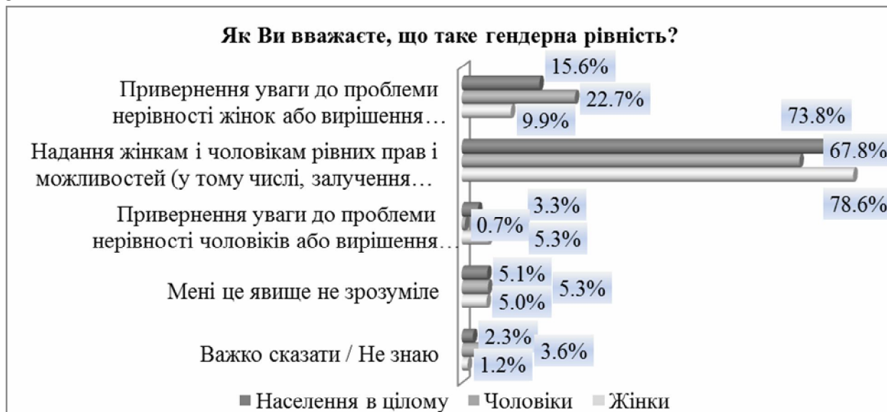
Діаграма 2. - Інтерпретації поняття ґендерної рівності

Цікавими є думки населення Криму щодо значення поняття ґендерної рівності.