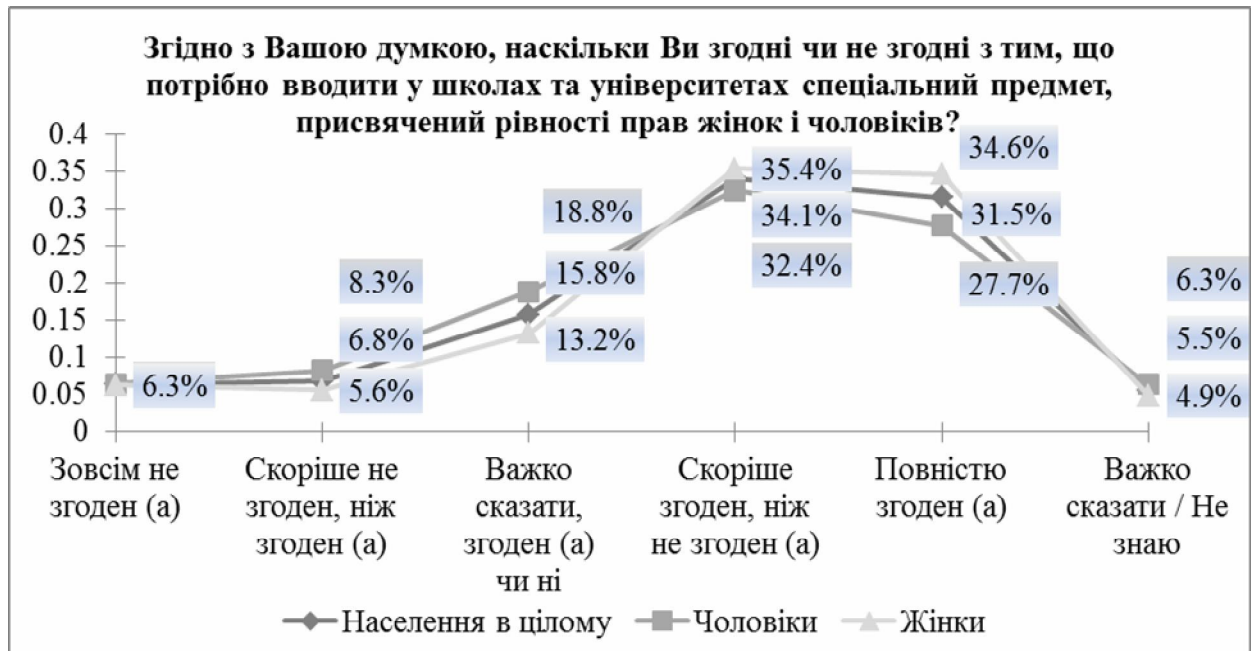
Діаграма 3. - Нормативні уявлення про необхідність запровадження в освітніх закладах спеціального предмету з ґендерної рівності

Тим цікавіше порівняти ці уявлення зі справжнім станом ґендерної (не)рівності у сфері освіти.