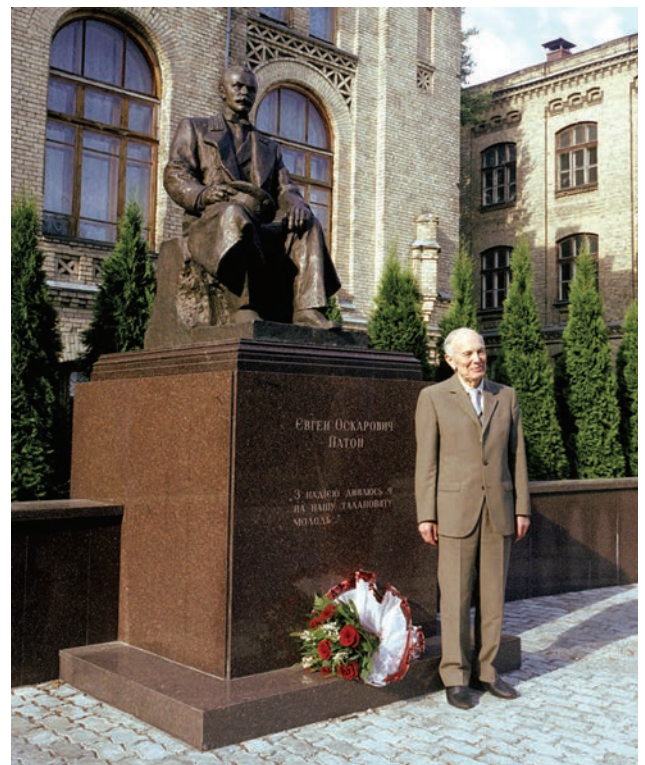
Академік Б.С. Патон біля пам'ятника Є.О. Патону в НТУУ «Київський політехнічний інститут імені Ігоря Сікорського». Автор-скульптор О.П. Скобліков, 2002 р.

На шану Євгена Оскарівича Патона у 2002 р. йому був споруджений пам'ятник роботи скульптора Олександра Скоблікова з вибитими на підніжжі словами «З надією я дивлюся на нашу талановиту молодь». Ці слова Євгена Оскарівича виявилися пророчими. Нові покоління київських політехніків вважають за честь вчитися на прикладі життєвого та трудового подвигу Патонів і ставати продовжувачами їх великих справ.