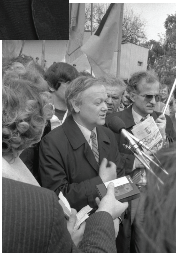
Заступник Голови Ради Національностей Верховної Ради СРСР Б. І. Олійник під час розмови з учасниками мітингу, організованого Народним Рухом України. Київ, 21 квітня 1990 р. Од. обл. 0-180650.