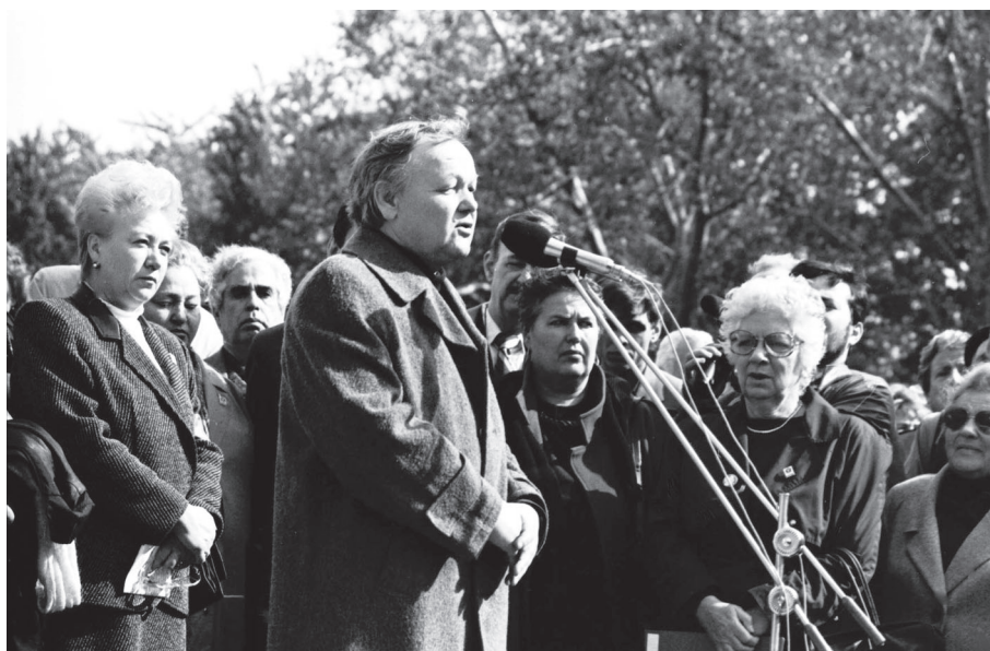
Б. І. Олійник – український поет, народний депутат СРСР виступає на мітингу, присвяченому 49-й річниці масового розстрілу у Бабиному Яру.

ЦДКФФА України ім. Г. С. Пшеничного. Од. обл. 0-202929.