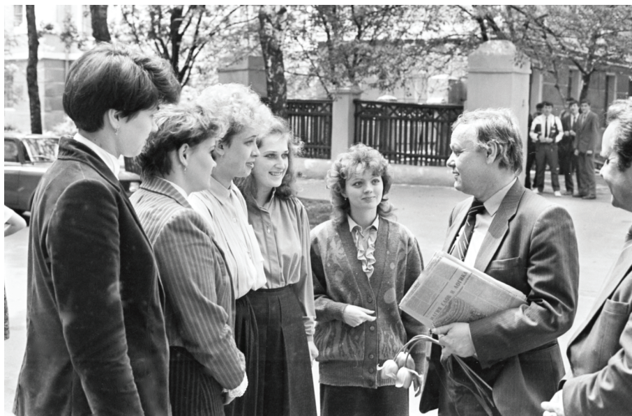
Український поет Б. І. Олійник під час бесіди зі студентами філологічного факультету Полтавського педагогічного інституту ім. В. Г. Короленка.