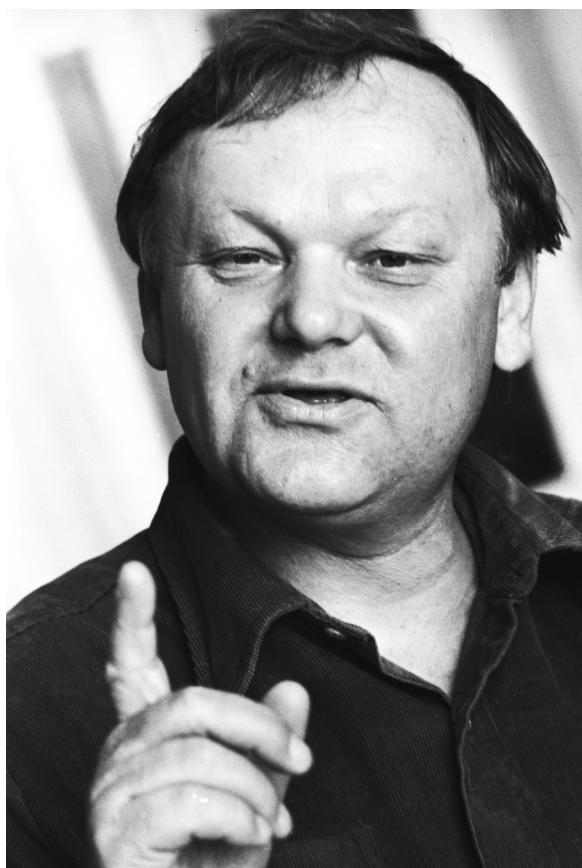
Б. І. Олійник – український поет, лауреат Державної премії УРСР ім. Т. Г. Шевченка. Київ, 10 вересня 1985 р. Автор зйомки – Б. Д. Градов. ЦДКФФА України ім. Г. С. Пшеничного. Од. обл. 0-234214.