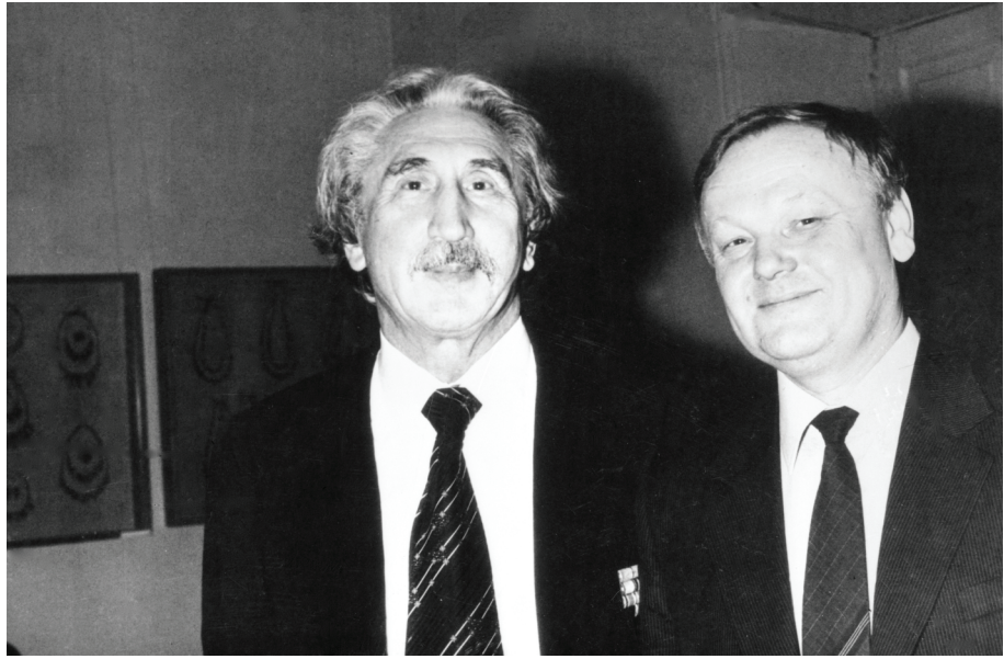
Український композитор Я. С. Цегляр (ліворуч) та український поет, академік АН УРСР Б. І. Олійник. 1980-і роки ХХ ст. Од. обл. П-11320.