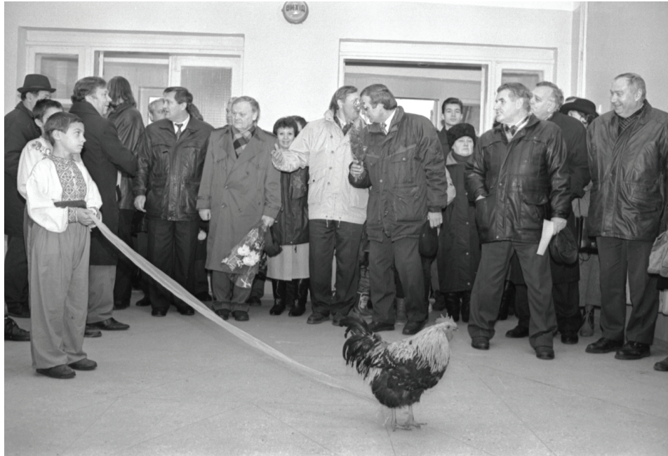
Урочисте відкриття нової середньої школи в смт Нові Санжари Полтавської області. 3-й ліворуч – народний депутат України, поет Б. І. Олійник. Нові Санжари Полтавської області, грудень 1996 р. Од. обл. 0-225433.