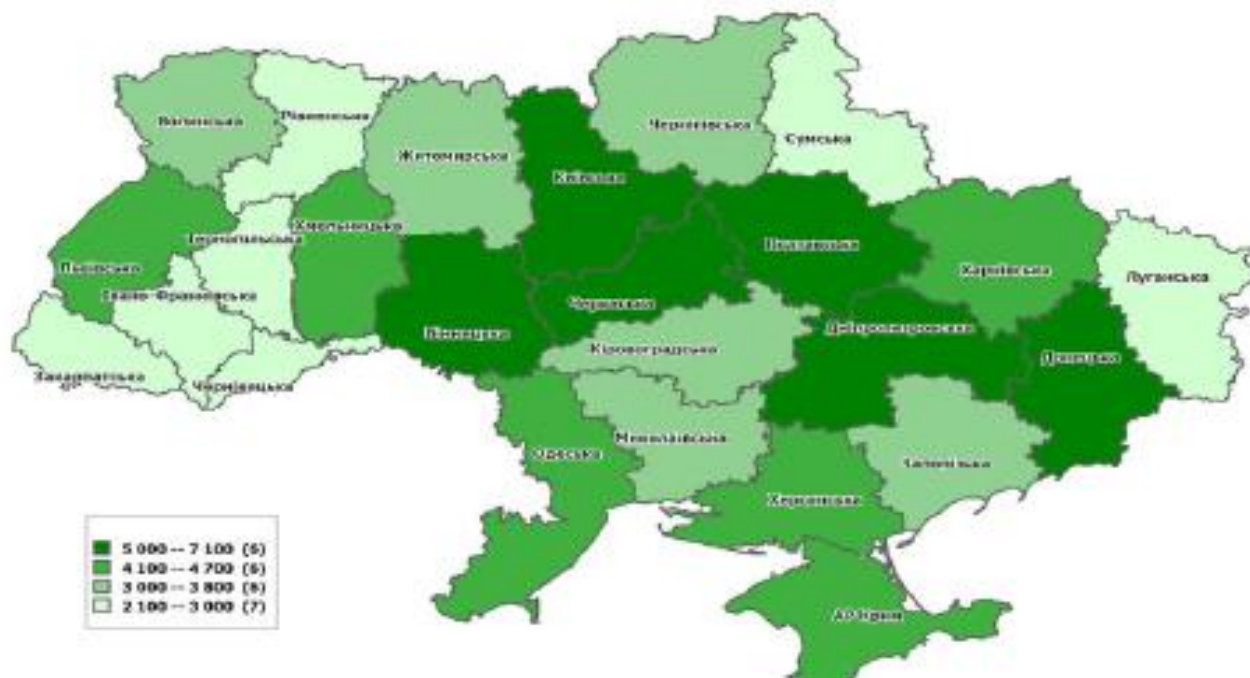
Рис.1 Виробництво сільськогосподарської продукції в регіонах України.

- другий етап (1999-2004 рр.) - саморегуляція аграрної системи під впливом внутрішніх адаптаційних механізмів враховуючи державне регулювання;