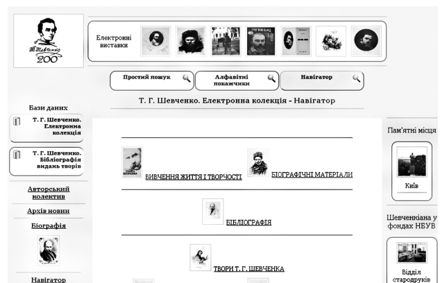
Рис. 1. Пошуковий інтерфейс електронної колекції

Інструментом перегляду матеріалів електронної колекції є іконографічний навігатор, який поділено на основні категорії: вивчення життя і творчості, біографічні матеріали, бібліографія, твори Т. Г. Шевченка (прижиттєві видання, кобзарі), пам'ятні місця, галерея (музеї, пам'ятники, меморіальні дошки), відеоматеріали, Інтернет (рис. 1).