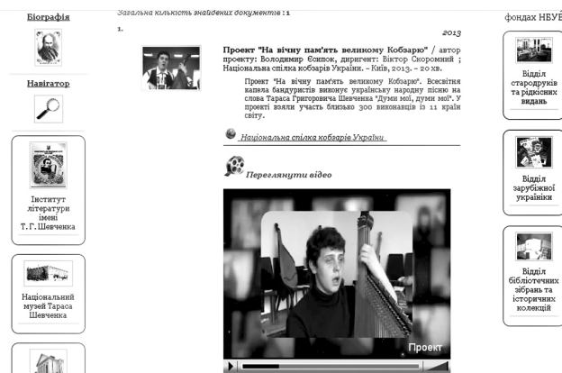
Рис. 3. Відеоматеріали електронної колекції

Програмний інструментарій електронної колекції також має засоби для розміщення аудіо та відеоматеріалів. Так, відеоряд електронної Шевченкіани представлено декількома національними кінопроєктами, у т. ч. проєктом «На вічну пам'ять великому Кобзарю», де Всесвітня капела бандуристів (близько 300 виконавців із 11 країн світу) виконує українську народну пісню на слова Тараса Григоровича Шевченка «Думи мої, думи мої» (рис. 3).