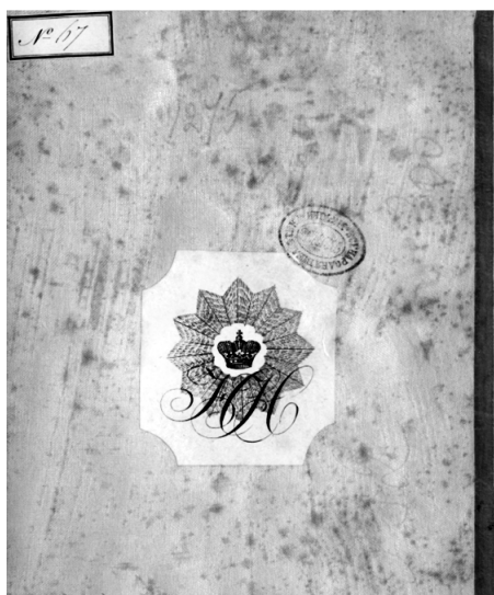
Екслибрис з вензелем

Формат перегляду бібліографічних описів карт передбачає отримання тематичних добірок за географічними рубриками через Рубрикатор НБУВ. Додаткові лінгвістичні переваги тематичного пошукового інтерфейсу уможливають безкоштовний сервіс Google Translate, який пропонує швидкий автоматичний переклад веб-сторінок багатьма мовами світу. Користувач, який вводить свій запит англійською, німецькою або російською мовою, може знайти лише частину інформації мовою запити. Для того, щоб відшукати картографічні документи, напри-