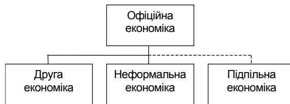
Рис. 2. Структура тіньової економіки щодо офіційної

Тіньова економіка в усіх її проявах утворюється за обставин, коли вигідно приховувати свою економічну діяльність або її результати від громадськості та держави. Рівень тіньової економіки в країні показує співвідношення операцій у грошовому вимірі, які перебувають поза звітністю, до рівня ВВП. Зауважимо, що на цей час не існує жодної методики, яка б надавала можливість точно оцінити обсяг тіньової економіки та її співвідношення з офіційною економікою.