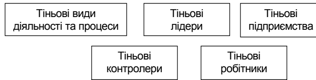
Рис. 1. Структура тіньової економіки

Щодо офіційної економіки тіньова економіка класифікується як: