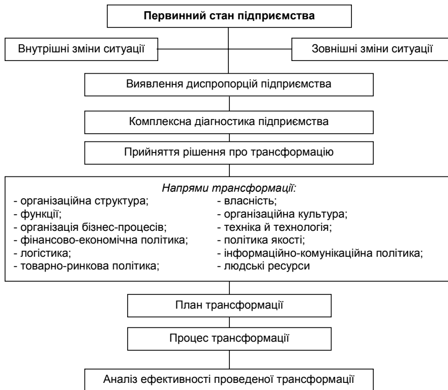
Рис. 2. Принципова схема трансформації підприємства

Першочергові напрями трансформації промислових підприємств повинні торкнутися проблеми зміни організаційної структури, власності та активів підприємства, впровадження інформаційних технологій, зміни взаємовідносин між підприємствами та державою, самими підприємствами, підприємствами й банками, а також реорганізації мережі промислових підприємств загалом та зміну способів її формування. Принципову схему трансформації підприємства подано на рис. 2.