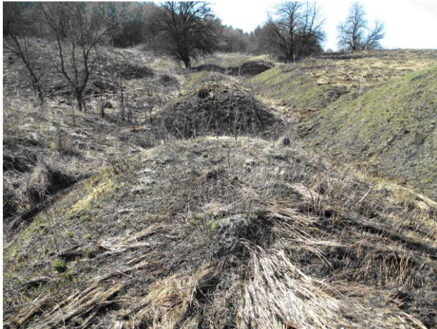
а) Горбисто-ячеїсті рови, що залиши-лися від колишніх бурячних

Понятовських, також цілком вартий того, щоби бути записаним в історію цукроварної галузі нашої Вітчизни. Віднайдений же і описаний нами антропогенний ландшафт, який утворився на місці його проммайданчика, є уречевленим свідком («індустріально-ландшафтним слідом» [24]) існування трощинської цукроварні. То ж і цю місцину слід