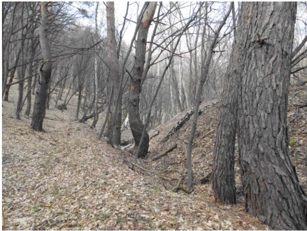
а) Антропогенні форми рельєфу – рів і вал, порослі стиглими і старими деревами (сосна, осика, береза, робінія псевдоакація)