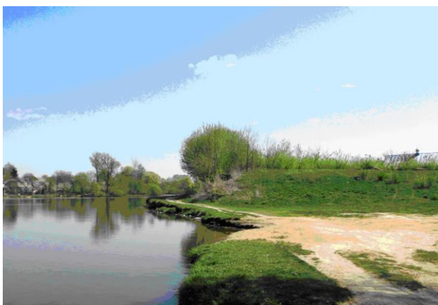
а) Платоподібне підвищення на березі міського ставка – штучна насипна форма рельєфу, яка залишилася від давнього цукрового заводу («Кочубея») і продовольчого комбінату, що існував на цьому ж місці в 1934-1991 роках

архівних записів неважко сплутати з «0», то число «1807» стане звичайною помилкою . Це лише наше припущення. Але в будь-якому разі дату спорудження в сучасному місті Бобровиці цукрового заводу в 1807 році слід піддати кардинальному сумніву, або хоча б вивести її з «обігу» історичних дат початку українського цукроваріння. Міфологічний характер числа «1807» непрямо підтверджує, з нашої точки зору, також і той факт, що жоден із авторитетних дослідників економічної