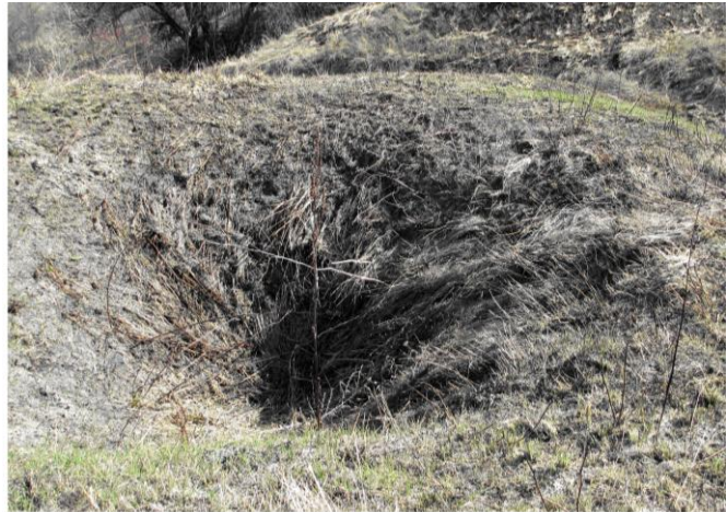
б) Карстова лійка, утворена у скупчен-нях вапнякового каменю або дефекату