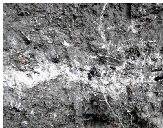
б) Разом з вапняковою смугою у похованому індустриоземі, розкритому в місці «А», видні шматки вугілля і цегли: це вказує на те, що тут був саме цукровий завод