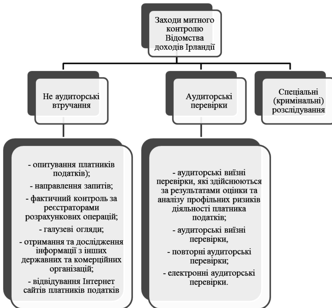
Рис. 2. Форми контролю, що здійснюються Відомством доходів Ірландії