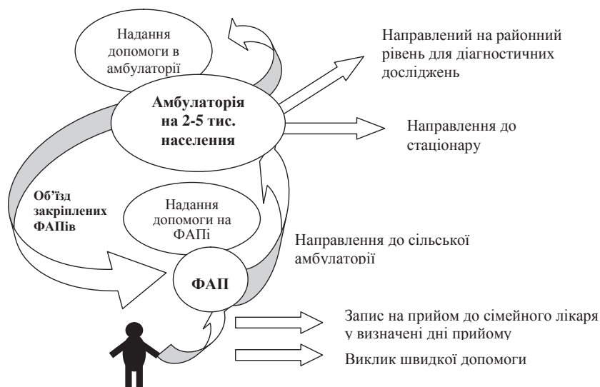
Рис. 2. Система роботи з пацієнтом на первинному рівні надання медичної допомоги в сільській місцевості

— проведення широкої роз'яснювальної роботи та інформування щодо мети, завдань, сутності та результатів перетворень, починаючи з представників центральних та місцевих органів влади, включаючи як медичних працівників, так і широкі верстви населення;