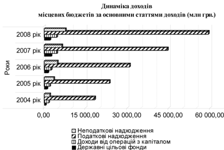
Рис. 1. Динаміка доходів місцевих бюджетів за основними статтями доходів (грн.) [10]

У статті 15 Закону України "Про систему оподаткування" визначені